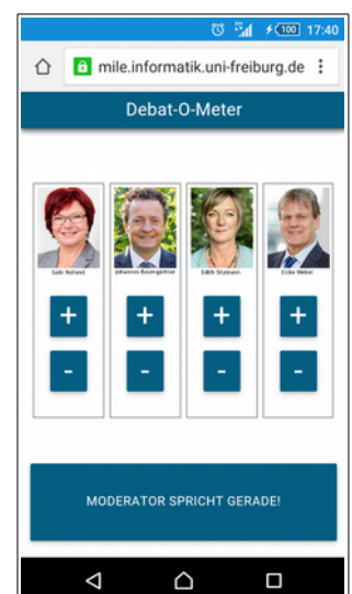
Abbildung 1: Debat-O-Meter